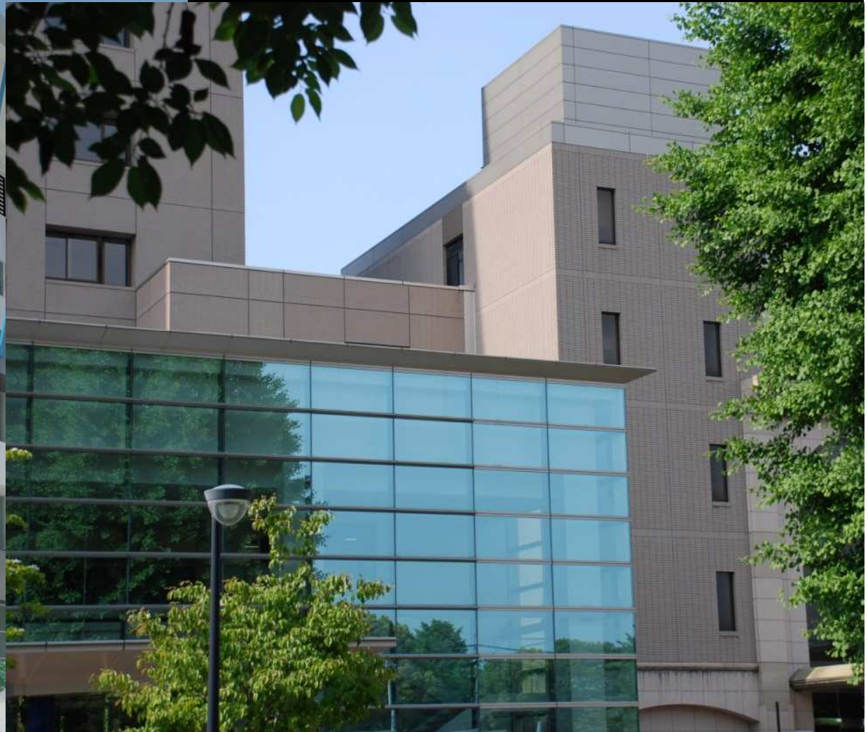
(b) School Building in Kumamoto