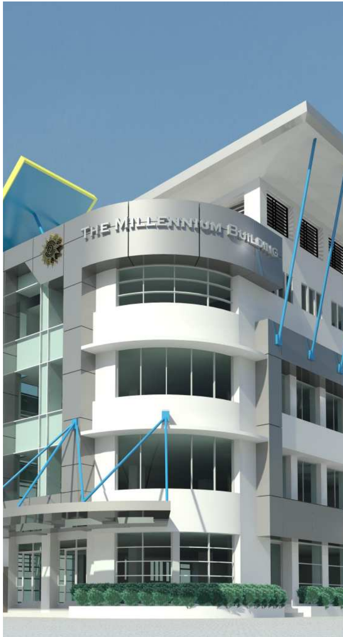
(a) The Millennium Building, Pucang